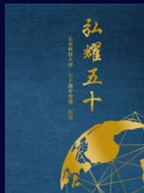
弘光科技大學 五十週年校慶特刊