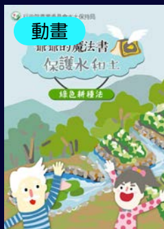
爺爺的魔法書 綠色耕種法