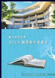
國立政治大學 圖書館年報